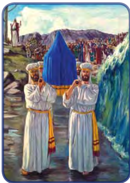
Írta: David Zic

Az öltözködési reform kérdése egyidejűleg egyszerű és bonyolult is. Egyszerű, mert a Szentírás és az ihletett írások világosan kiemelik ennek fontosságát és világos oktatást adnak erre vonatkozóan. Azonban bonyolult is, mert túl sokáig nem vettük komolyan ezt az ügyet. Míg néhányan sóhajtoznak és sírnak a világi divat egyre növekvő befolyása miatt, amint ma ez népünk között látható, a többség arra hajlik, hogy félretegye ezt a kérdést, mintha lényegtelen lenne. Ezen reform évekig tartó elhanyagolása Isten hitvalló népének általános állapotából adódik. Most úgy kell felvennünk a harcot a divat ellen, mint soha ezelőtt, vagy szembesülni fogunk a következményekkel, melyek romlásba visznek bennünket.